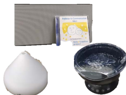
当センターのスヌーズレンルームのグッズ！

申し込み方法：①センターHPの「セミナー申し込み」： http://www.educ.juen.ac.jp