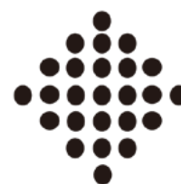
図6 第7時のおはじき図