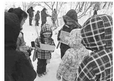
図3 二貫寺の森ツアーガイドの様子

記述から、C児の行動が、他の子どもの思考に影響を与え、行動を変容させていることが読み取れる。