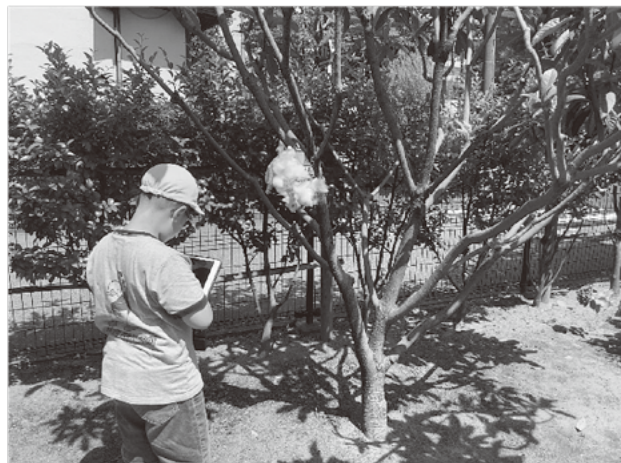
〈図6：C児が作品を撮影する姿〉