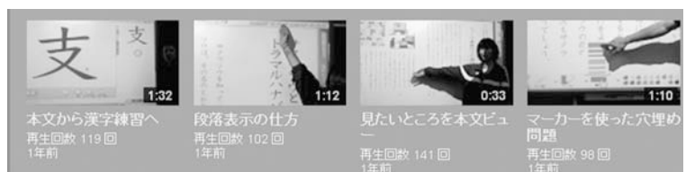
図9：YouTubeへ掲載した国語でデジタル教科書の活用紹介コンテンツ

誰にでも分かりやすい説明になっているか、機能の位置や操作の仕方が詳しく説明できているかなど、具体的なアドバイスをしながら研修を進めた。このように、自分で活用方法を「説明しよう」という意識が生まれることで、操作にも慣れるようになる。また、「紹介すること」は操作方法を理解し、「自分のものにする」ことにもつながった。