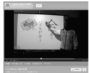
図7：YouTubeへ掲載したコンテンツ2

コンテンツの作成には、時間と労力が必要になるが、「自分が出演し、紹介することで全体に貢献できる」という意識が作成意欲を上げ、ストレスをあま