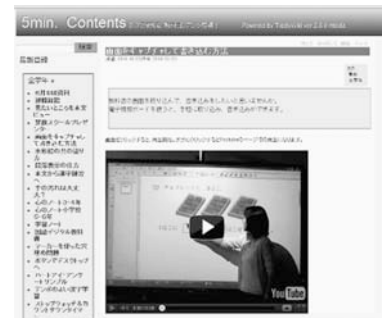
図13: 「5 min.コンテンツ」画面2