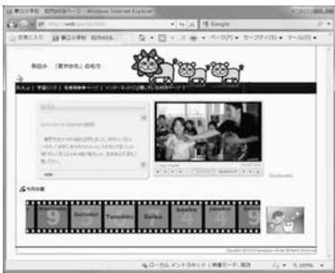
図11: 「あやかたのもり」画面

ICT機器の活用に慣れている職員は、授業の中での活用が広がっている。しかし、機器を使えるけれど使わない職員や慣れていないために活用できない職員もいる。そこで、教科の学習以外での活用場面を考え日常的に活用しやすい環境を整備することにし、校内ポータルサイトの活用を始めた。