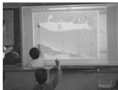
図1：デジタル教科書の挿絵を活用した授業場面

また、職員が主体的に研修するように意欲を喚起する方策を考えた。動画を見て研修する形態だけだと、どうしても受け身的になり、各職員の実践へとつながりにくい。そこで、取組や実践の成果を自ら発信する研修を考えた。動画に記録するために自己表現したり、取組を振り返ったりする経験が実践意欲につながると考えるからである。具体的には、