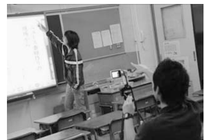
図8：5学年の研修の様子

誰にでも分かりやすい説明になっているか、機能の位置や操作の仕方が詳しく説明できているかなど、具体的なアドバイスをしながら研修を進めた。このように、自分で活用方法を「説明しよう」という意識が生まれることで、操作にも慣れるようになる。また、「紹介すること」は操作方法を理解し、「自分のものにする」ことにもつながった。