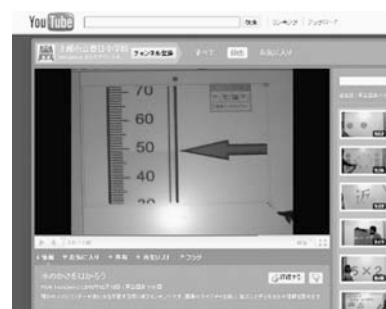
図6：YouTubeへ掲載したコンテンツ1