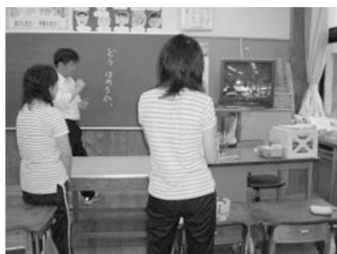
図3：授業リフレクション

日常、授業に一番活用されている機器は、電子情報ボードであるが、ビデオカメラや書画カメラ、スキャナなど、学習場面に応じて、効果的に活用するようにしている。