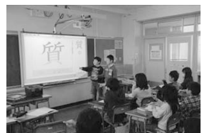
図10：「本文から漢字練習へ」の機能を使って漢字練習をしている様子