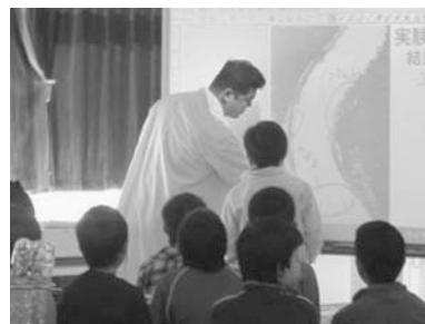
図2：仮説と実験の様子を比較している授業場面