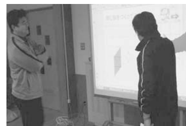
図4：発表コンテンツの検討の様子

E教諭は、特別支援学級の担当で、日ごろから自作コンテンツを活用して指導に当たっている。「読むこと」に困難さのある子どもへの指導のために、「言葉への理解」や「視覚的に文字の形を認識できる」デジタル教材を作成した。