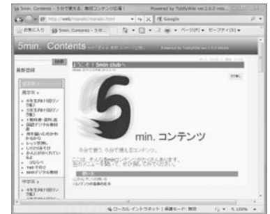
図12: 「5 min.コンテンツ」画面1

校内ポータルサイトから手軽に利用できるようになっている。また、コンテンツを選ぶと、YouTubeの「春日小チャンネル」へリンクされているものもあり、動画で活用方法を確認して、効果的に活用することができるようになっている。