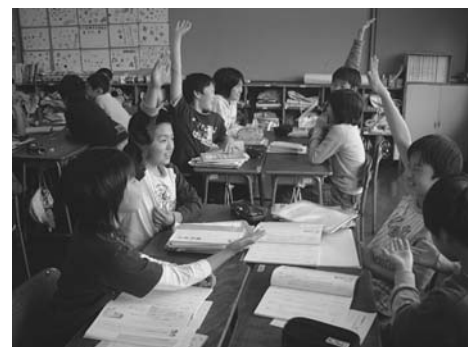
【図3：グループ討論の様子】

小学校学習指導要領解説国語編の聞くことに関する指導事項に「高学年では、話し手の意図をとらえながら聞き、自分の意見と比べるなどして考えをまとめること。」 5) とあるように、討論が成立するためには、発言者の意図や考え方を聞き取らなければならない。また、深まりのある討論に発展させていくためには、批判的に聞き、話の論理性を正しく聞き取る力が必要となる。そこで、4人~5人のグループを二手に分け、グループごとにそれぞれ相対する立場に分かれてディベート形式の討論【図3】を行った。このようなディベート形式の討論では、初期段階の傾向として、話す