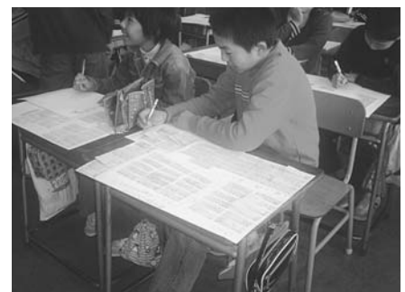
【図5：構想メモを書く子供】