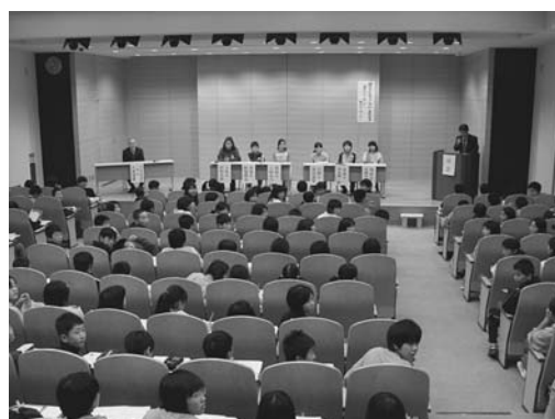
【図7：縄文子どもフォーラム】