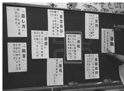
【図6：発言をかみ合わせるための指導】

本実践において総合学習のまとめの活動として位置付けた「縄文子どもフォーラム」【図7】では、200人を越える子供たちの中で、活発な討論を繰り返すことができた。フォーラム後の感想にもパネルディスカッションやポスターセッションで自分の思いを表現したり他校の子供たちと意見を交換したりすることに充実感や達成感を感じている子供が多くいることが分かった。今回の実践で、子供たちが対話能力を高め、自信をもってフォーラムに参加したことが活発な議論や充実感の獲得につながった一因であろうが、今までの総合学習で追求してきた自己の学びを知らせたい、分かってもらいたいという強い思いがあったことも大きな要因となっているであろう。言い換えれば、他者に伝えたいという思いを醸成できたことが、本実践での子供たちの「対話能力」の向上につながったとも言える