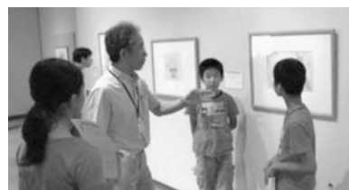
写真2 学芸員から立ち位置のアドバイスをうける