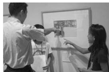
写真3 赤いポストを話題にする子ども