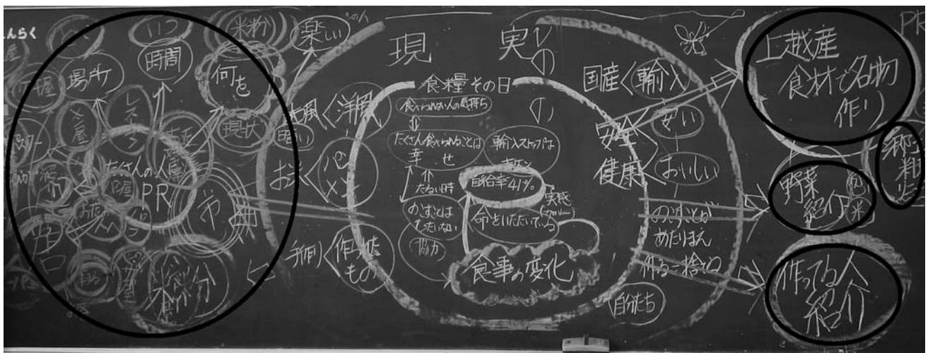
写真3 12月の集団言語活動におけるFG記録

社会の厳しい現実を乗り越えるための方法として、子どもたちが苦勞して創造した活動だからこそ、2回に渡って活動を行うことを選択し、発展していくことになった。FGで現実に風穴をあげる活動というイメージを子どもたちが掴めたため、自分たちの取組は小さくても重要な意味があることを認識していたのであろう。