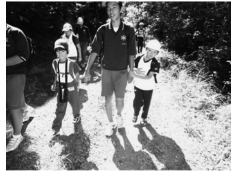
写真1 小中合同遠足の様子

自分の指示に従い、頼ってくれた小学生に対する思いが、喜びに終わらずに感謝にまで変わっていつている。心情を素直に表現できる小学生の言葉から、今日の目的を再認識する中学生の姿が読み取れる。目的を達成できた喜びや、相手からかけられた言葉により自分は相手の役に立っているということに気付いていったことが伺える。活動に臨む前は自分に自信がもてず、不安をもちながら参加していた児童・生徒が、メンバーのみんなから頼りにされていることを感じ、その期待にこたえていこうとする意欲をもち、自信をはぐくんでいったのであろう。