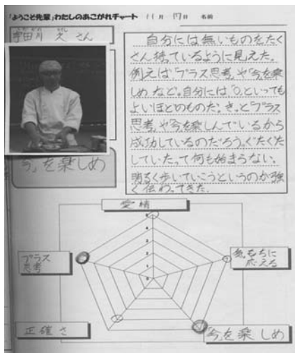
図-1 個人チャート図

個人でのまとめ学習をベースに、個人で見付けたキーワードを共有化し、整理し、「仕事をするために必要なキーワード」としてまとめた。(図-2)