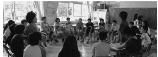
図3 男女交互の円で話し合うスタイル

話合いは、図3のようなスタイルで行ってきた。話題の中心から全員が等距離に座っていることで、一人一人の意見が平等で大切であるという意味合いがある。あいさつの向上、言葉遣いの改善、修学旅行先で歌の決定など、15回の話合いに取り組んだ1学期の最後に、「学校で肝試しをしよう。」と題して、学級イベントの話合いを行った。校長や保護者の承諾を得るため、目的を真剣に話し合う子供たちの姿が見られた。事前準備は、夏休みの課外活動の後に、特別な事情がない限り全員が自主的に居残って行っていた。当日は、保護者も参加し、小学校生活最後の夏休みに最高の思い出を創ることができた。もちろん、翌日の課外の前に早めに登校して、後片付けも自主的に行っていた。肝試しの実行委員であったC児は、1学期の話合いを振り返り、次のように書いている。