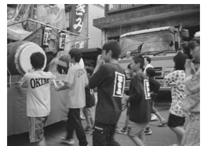
写真1 上越祭りの様子

上越祭り（上越市直江津地域の祭り）の様子を撮影したビデオを見せた。ビデオでは、各町内の屋台が太鼓や笛の音色に合わせて行進している。何時間も演奏しながら行進するため、太鼓を打ったり笛を吹いたりするビデオの中の子どもたちは、時々休みながら、肩の力をぬいて楽しそうに演奏していた。どこの町内でも、和太鼓は2台、笛が数人～10人くらい、鉦一人という構成である。和太鼓の迫力だけでなく、笛が入ることで流れるような旋律が加わり、さらに鉦が入ることで音に華やかさが加わる。児童は、自分たちと同じ年くらいの子どもが太鼓を打ったり笛を吹いたりする様子を食い入るように見ていた。学校の音楽室にもある楽器「鉦」を見つけ、「見たことある！」と話す姿が見られた。