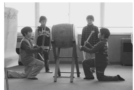
写真3 かがやき太鼓の発表

作った曲は「かがやき太鼓」と名付け、学習参観の日に発表した。全員の保護者が駆けつけ、また、葎谷太鼓の方も駆けつけ、子どもたちの「かがやき太鼓」に拍手を送った。また、そのときの演奏を録音し、CDにして配布した。子どもたちは「おばあちゃんが何回も聞いていたよ」「楽しかった。もう1回やりたくなった」と大喜びであった。