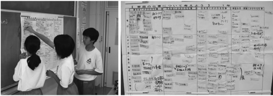
写真3 【「家庭の仕事」マップに付箋を貼る様子】