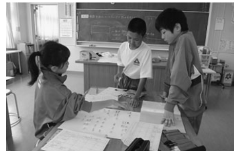
写真1【各班の話し合いの様子】

オ 各班の発表を聞いている生徒はワークシートに分かったことや参考になった点、工夫した点を記録していった。