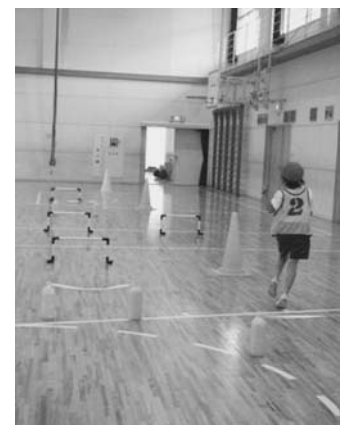
〈写真2 児童が作ったコース〉