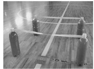
〈写真1 ペットボトルハードル〉

使う障害物の数を同じにして、次時のリレー遊びに使うコースを作って走った。使った障害物はペットボトルハードルを3つ、コーンを2つである。走って楽しいコース、調子よく走れるコースを目指そうと活動を始めた。前時に作った障害物をたくさん入れたコースとは違い、走る部分が多くなるため、用具をたくさん使う楽しさがなく、初め、児童は物足りなさを感じていたようである。