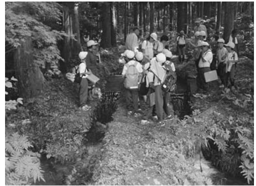
【2つの地区に水を分け分水マス】

最後に、真光寺地区だけでなく、大和川地区、釜沢地区も同じ思いで用水を引きたいと思っていたことを確認し本時を終了した。