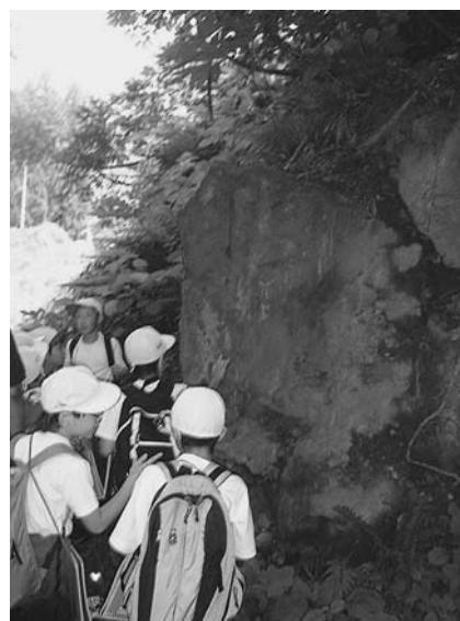
【ダイナマイトを使って岩を砕いたあと】