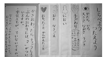
〈見つけたよカード〉

次に、「見つけたよカード」 6) に見つけたことを書き出し、仲間分けする。この「見つけたよカード」は目、耳、鼻、手、自分の思いの5つの観点ごとに異なる色のカードにする。そのことで、児童に足りない観点を色で視覚的にとらえさせ、新たな観点到に気づかせる。さらに、7人という少人数を生かし、特定の部位について、全員で書いたものを発表し合う。そこで、それぞれのよさや詳しい表現の有効性に気付かせれば、児童はさらに詳しく観察したり、詳しい文を書こうとしたりすると予想した。