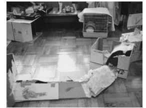
〈モルモランド完成〉

2ヶ月が経つ頃、体重が増えてきたモルモを運動させようと、遊び場を作ることにした。ダンボールや空箱などの廃材を好きなだけ使い、各自が自由に家を作った。実際にモルモを入れて遊ばせていると、モルモの好みの環境が明らかになった。自ずとモルモが隠れる所、広い遊べる所へとモルモの立場での制作に変わった。また、糞の始末がしやすいよう、屋根が取り外しできるように工夫したものもあった。紙製のため、どうしても糞尿や埃で汚れてしまい、長期間使えないのがもったいなかった。しかし、飼育場所として教室環境を見直すことにつながった。「モルモランド」は相手の立場を考えるきっかけになった。この活動を通し、モルモの視点で制作する想像力と観察力をつけた。そして、「モルモが寝ているよ。静かにしよう。」「大きな音を出すと、びっくりしてすぐ隠れちゃうよ。かわいそうだよ。」など共同生活者としてのモルモへの配慮を引き出した。