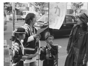
写真5 チラシを渡して米を宣伝

米販売は、例年11月の宿泊体験学習の時に東京・銀座で行う。キャリア教育の一環として米販売をしているが、自分たちが作った米をどのようにアピールして客に買ってもらうかを、全校児童で話し合う。「私達が作った米がなぜおいしいのか」を、これまでの活動をもとに考えさせる。そこで、「水がいい」、「空気がいい」、「適した温度になっている」など、環境に関する答えが出てくる。その後、販売する時に客に渡すチラシを作成する。その際、私たちの米は環境の良い地域で育ったことをアピールしたり、児童が体験した田植えや稲刈り、脱穀などの生産過程が分かるようにしたりしながら、作成していく。