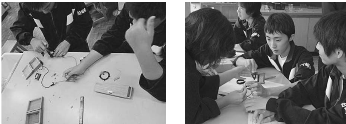
図3 探究活動の様子