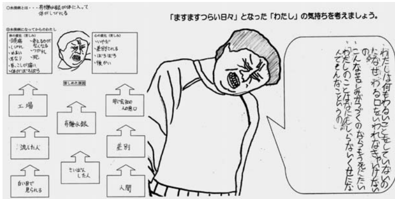
図1 児童の学習プリント「ある水俣病患者の訴え」

悲しみ、怒りなどを露わにする子もいた。「近くの海なので自分にも関係ある。」等、他人事ではないことを感じ始めた。