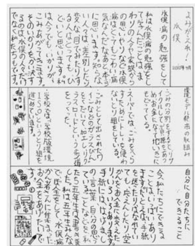
図6 児童が作成した新聞