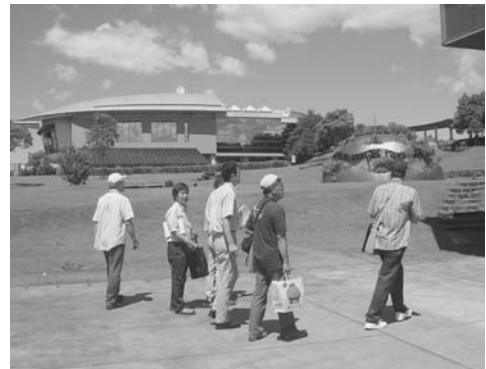
写真1 ヘドロを含んだ埋め立て地にある資料館と環境センター