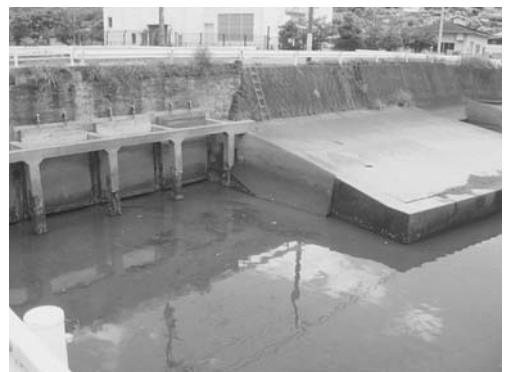
写真2 現在の百間排水口

工場に赤色と埋め立地に青色を塗らせ、広さを確認した後、チツソ水俣工場の排水中の有機水銀によって水俣病が発生したこと、現在は工場から出た水銀を含むヘドロをドラム缶に封鎖し、海に埋め立てていること写真を提示し、説明した。また、有機水銀を流した百間排水口を地図で確認し、その水銀が何処まで行き、どの地域でどのくらいの犠牲者が出たかを資料として提示した。また、ヘドロの埋め立て場所の写真(写真1)、百間排水口の過去と現代の写真(写真2)、現在のチツソ水俣工場の写真(写真3)を見せた。