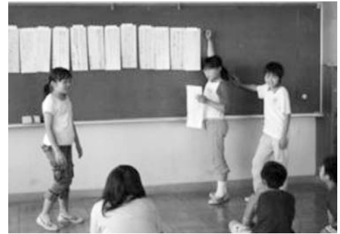
写真4. 短冊を黒板に貼る

また、「ふれあい・なかま」と教科としての音楽との関連では、創造的探求心に重きを置いた。そのための工夫として、単なる歌詞づくりをするのではなく、教科音楽との関連を図り、言葉と音のイメージを膨らませることで、自分たちがつくりたいテーマソングに迫っていけないかと考えた。この活動を通して、本稿資料1.の「領域C イメージや感性を豊かに創造する力」に掲げられた力が培われたものと捉える。加えて、「創造的に音楽にかかわる」ために、言