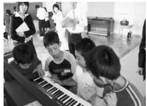
写真5. イメージに合う音探し