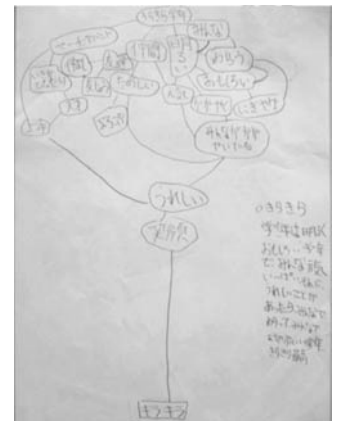
写真3. イメージマップ

きらきら学年のイメージについては、子どもたちから、言葉によるさまざまな表現を募った。その結果、「学年みんなのよさや、普段の姿が感じられる明るい紹介風の曲にしたい」という願いを掲げて、テーマソングづくりに取りかかった。活動を進めながら、「きらきら学年」から連想する言葉を集め、特に多かった「キラキラ」と「仲間」を『決め言葉』と定めた。次に、こうした決め言葉をベースとしながら、「きらきら学年」から始まり、決め言葉に結び付けるイメージマップづくりを行い、出てきた言葉をつないでひとつなぎの文章を作成する作業に挑んだ。（写真3. 参照）